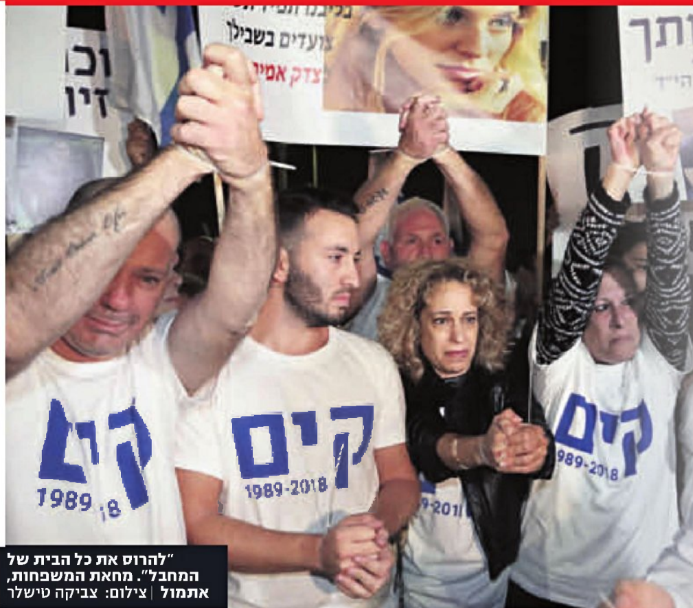
"להרוס את כל הבית של המחבל". מחאת המשפחות, אתמול